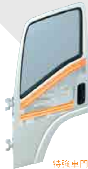
特強車門防撞骨架